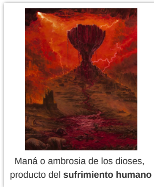
Maná o ambrosia de los dioses, producto del sufrimiento humano

¿Qué es loosh entonces? Loosh es la moneda etérica , (1) respaldada por una sólida inversión emocional de tinte negativo, formadora y destructora de civilizaciones ; pueden interesar los centavos y monedas de un ritual en nombre de una deidad en particular: el oxímoron de una dádiva chupacirios , pero lo importante son las calamidades globales: la guerra, la peste, el hambre y por supuesto, las delicias de la tortura y el sufrimiento extremo producidas, entre otros casos, por los sacrificios rituales : bajo el paradigma del loosh esta era la forma de pacto con las deidades veterotestamentarias; de las Transcripciones Cassiopaea , Laura Knight-Jadczyk pregunta (Sesión del 30 de Julio de 1994):